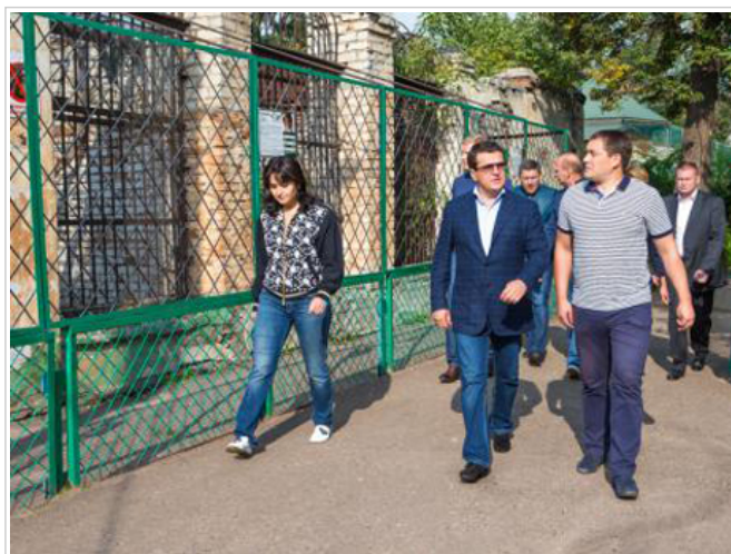
Ильсур Метшин сообщил, что на реконструкцию зоопарка в Казани постановлением правительства республики выделяется 1 млрд. рублей

На стройплощадке пока работают от 20 до 50 человек, несколько единиц спецтехники. В пиковые дни количество рабочих увеличится до 500 человек — когда часть строений уже будет возведена, начнется отделка помещений. В компании, построившей такие объекты, как «Казань Арена» и Иннополис, зоопарк называют «объектом средней степени сложности». Но при этом знакомым, поскольку начала строительства жители Казани ждали долго, а сам проект лично курирует врио президента РТ Рустам Минниханов . В декабре мэр столицы РТ Ильсур Метшин сообщил, что на реконструкцию зоопарка в Казани постановлением правительства республики выделяется 1 млрд. рублей.