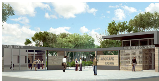
От первоначального предложения построить на месте казанского зооботсада гору из бетона решено отказаться в пользу совершенно новой концепции в сафари-стиле

Одним из главных объектов внимания посетителей обещает стать вольер с африканскими слонами: четыре самки во главе с вожаком. Поскольку это уже мини-стадо, слоновий вольер в 3,36 тыс. кв. м будет самым большим. Первоначально планировалось привести индийских слонов, которые отличаются от африканских меньшим размером ушей, даже были подготовлены эскизные варианты вольеров в колониальном стиле, но в итоге оформление было переделано под саванну.