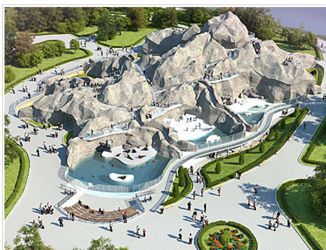
Прежние варианты «пристанца животных» были отклонены, в том числе проект «Волшебная гора»

Особое внимание в рамках проекта уделено логистике. Зоны отдыха по разным берегам озера будут соединены между собой пешеходными и велодорожками вдоль береговой линии и железнодорожного переезда. Старую и новую часть зоопарка соединит тоннель под железнодорожной веткой. При этом у обеих частей зоопарка будут свои отдельные входы. Так как уже сегодня припарковаться в этих местах — это большая удача, рядом с зоопарком с двух сторон будут открыты три парковки на 600 машино-мест (на 110, 190 и 200).