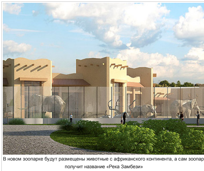
В новом зоопарке будут размещены животные с африканского континента, а сам зоопарк получит название «Река Замбези»

Однако, как пояснили газете «БИЗНЕС Online» в «Татинвестгражданпроекте», от создания горы в последствии было решено отказаться. Красиво, но нефункционально. В зоопарках Европы, например, в Праге или Зальцбурге, где также обыгрывается темы горы, она сама имеет природное происхождение. Возводить же гору для животных из бетона нерационально.