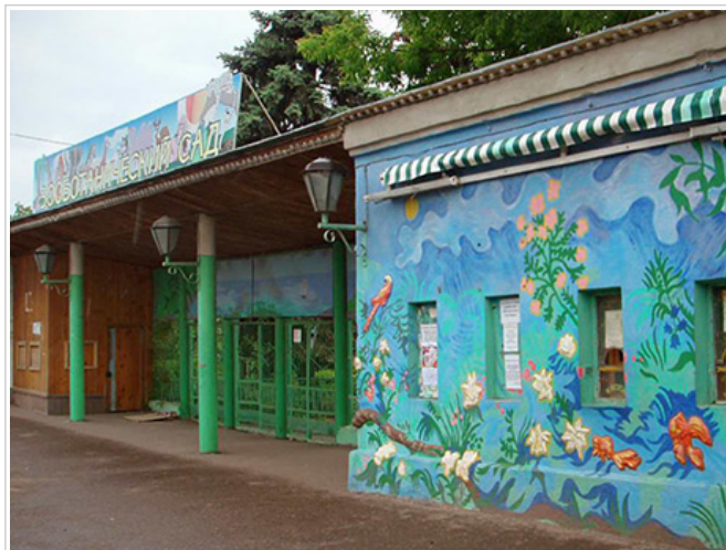
Казанский зоопарк оставили на его историческом месте, где он располагается уже свыше 180 лет, присоединив новые территории